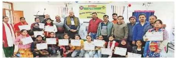
उन्मुखीकरण कार्यक्रम में प्रतिभागिता प्रमाणपत्र के साथ एनएसएस स्वयंसेवक व अन्य।