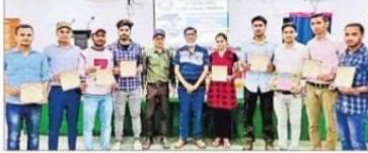
प्रतियोगिता में बेहतर प्रदर्शन करने वाले प्रतिभागियों के साथ प्राचार्य.