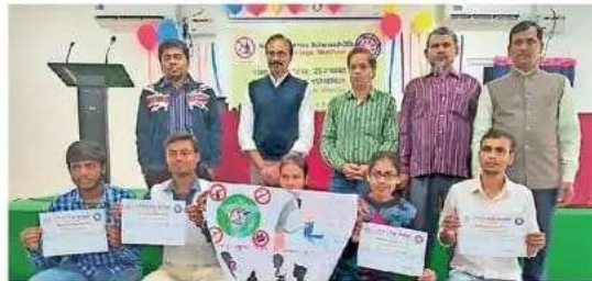
एलएनडी कॉलेज में आयोजित प्रतियोगिता में शामिल प्रतिभागी व अन्य।