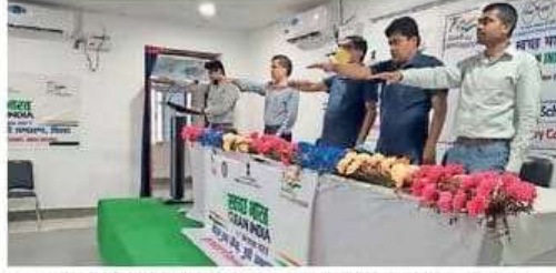
एलएनडी कॉलेज में सामुदायिक स्वच्छता की शपथ लेते स्वयंसेवक।